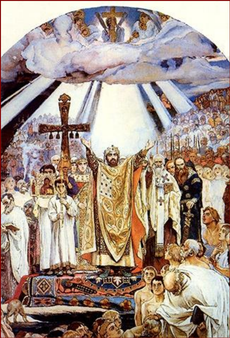
В. М. Васнецов. Крещение Руси.