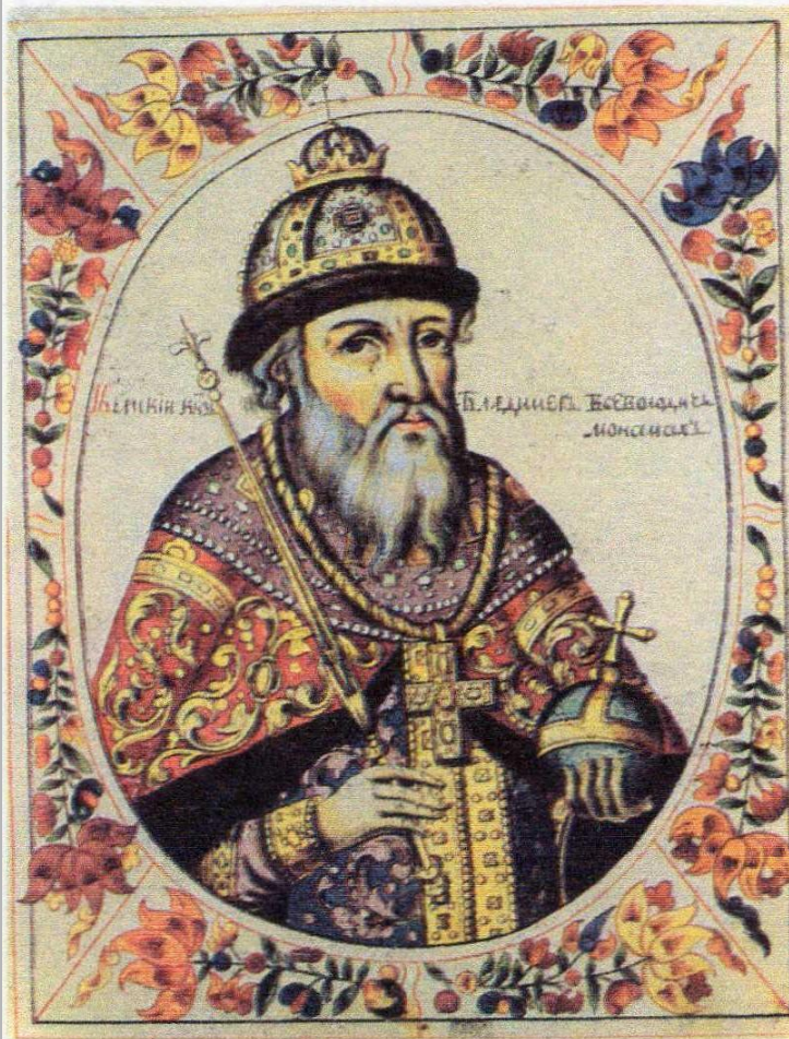
В Великий князь Владимир II Всеволодович Мономах.