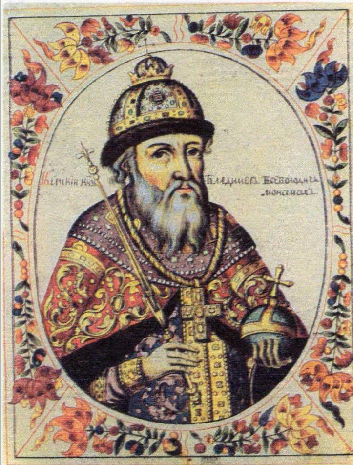
V Великий князь Владимир II Всеволодович Мономах.