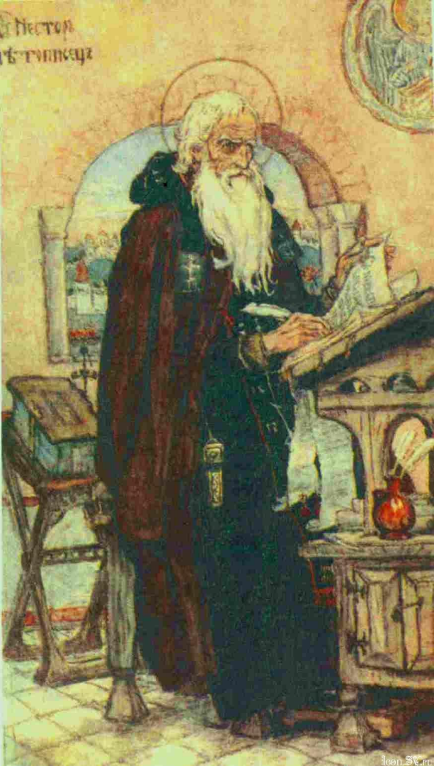
Виктор Михайлович Васнецов «Нестор-летописецъ»