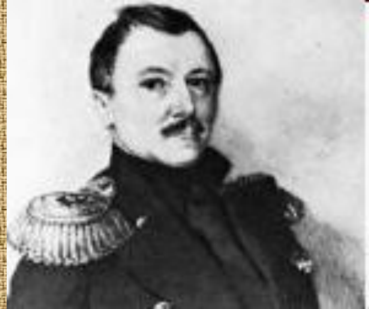
МАТЮШКИН Федор Федорович

Ты сохранил в блуждающей судьбе Прекрасных лет первоначальны нравы: Лицейский шум, лицейские забавы Средь бурных волн мечталися тебе; Ты простирали из-за моря нам руку, Ты нас одних в молодой душе носил И повторял: «На долгую разлуку Нас тайный рок, быть может, осудил!»