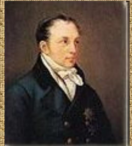
Егор Антонович Энгельгардт. С марта 1816 — директор Лицея.