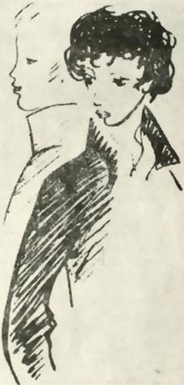
Рисунок Н. Рушевой

Дай руку, Дельвиг, что ты спишь? Проснись, ленивец сонный! Ты не под кафедрой лежишь, Латынью усыпленный. Писатель, за свои грехи Ты с виду всех трезвее; Вильгельм, прочти свои стихи, Чтоб мне заснуть скорее!