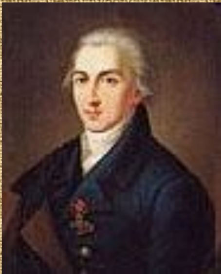
Василий Федорович Малиновский первый директор Царскосельского лицея

И первую полней, друзья, полней! И всю до дна в честь нашего союза! Благослови, ликующая муза, Благослови: да здравствует лицей! Наставникам, хранившим юность нашу, Всем честью, и мертвым и живым, К устам подъяв признательную чашу, Не помня зла, за благо воздадим.