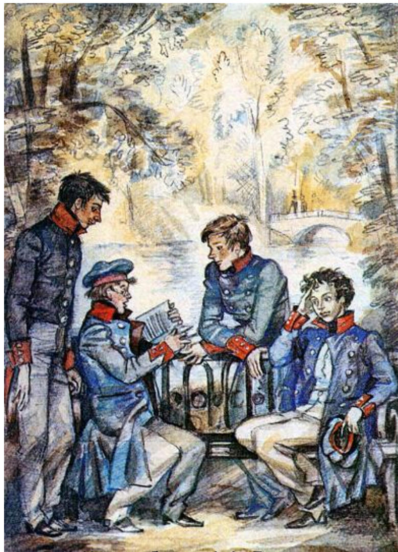
В.К. Кюхельбекер, А.А. Дельвиг, И.И. Пуцин, А.С. Пушкин.