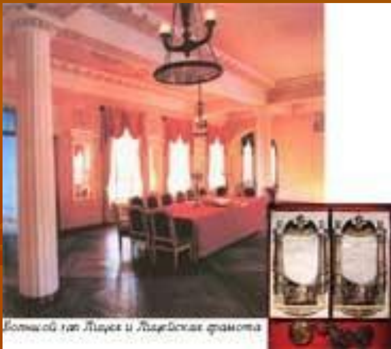
Большой зал Лицея и Лицейские фразы