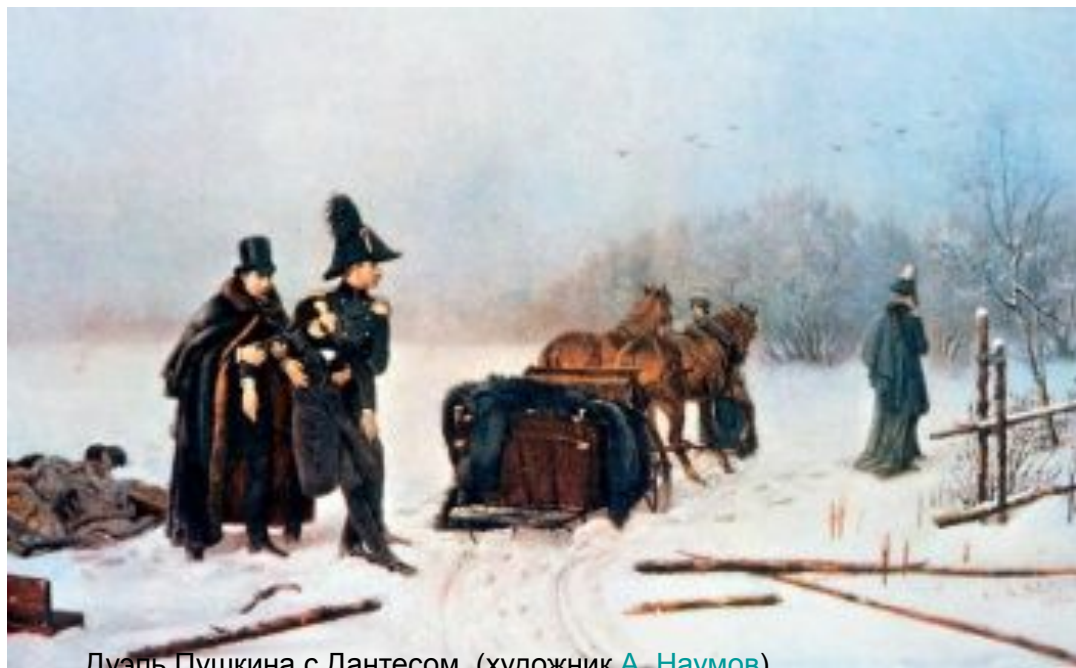
Дуэль Пушкина с Дантесом. (художник А. Наумов )