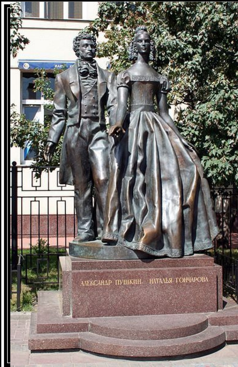
Памятник Пушкину и Гончаровой на Арбате. Скульптор — А. Н. Бурганов