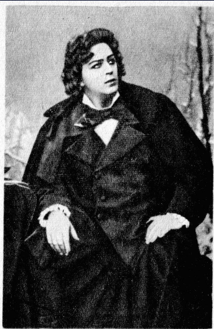
Л. В. Собинов в роли Ленского в опере Чайковского «Евгений Онегин»