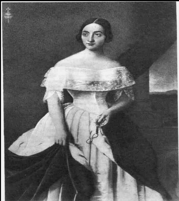
Екатерина Николаевна Гончарова.