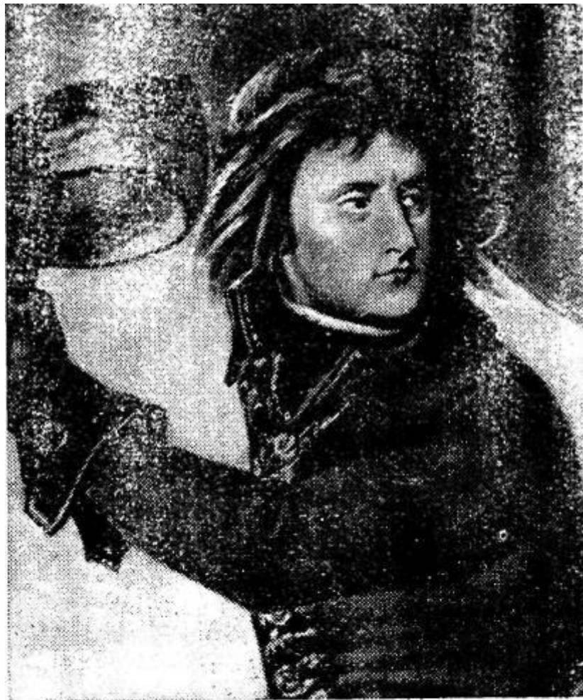
Бонапарт при Арколе С портрета работы А. Гро