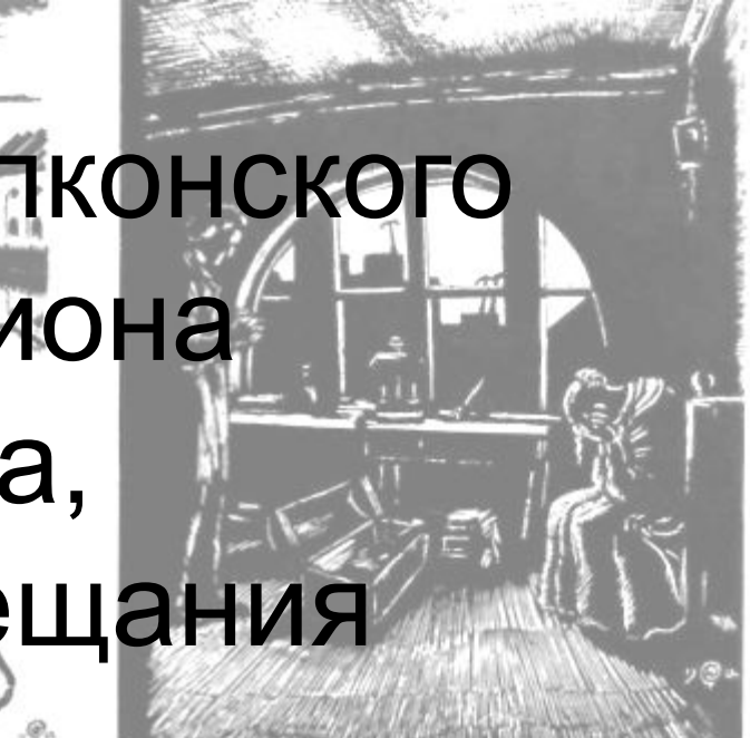
Повесть «Белые ночи» Настенька в комнате жилье