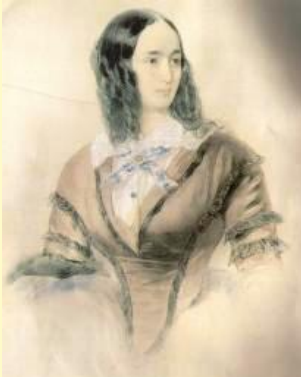
В.Гау. 1842 Наталья Николаевна Пушкина.