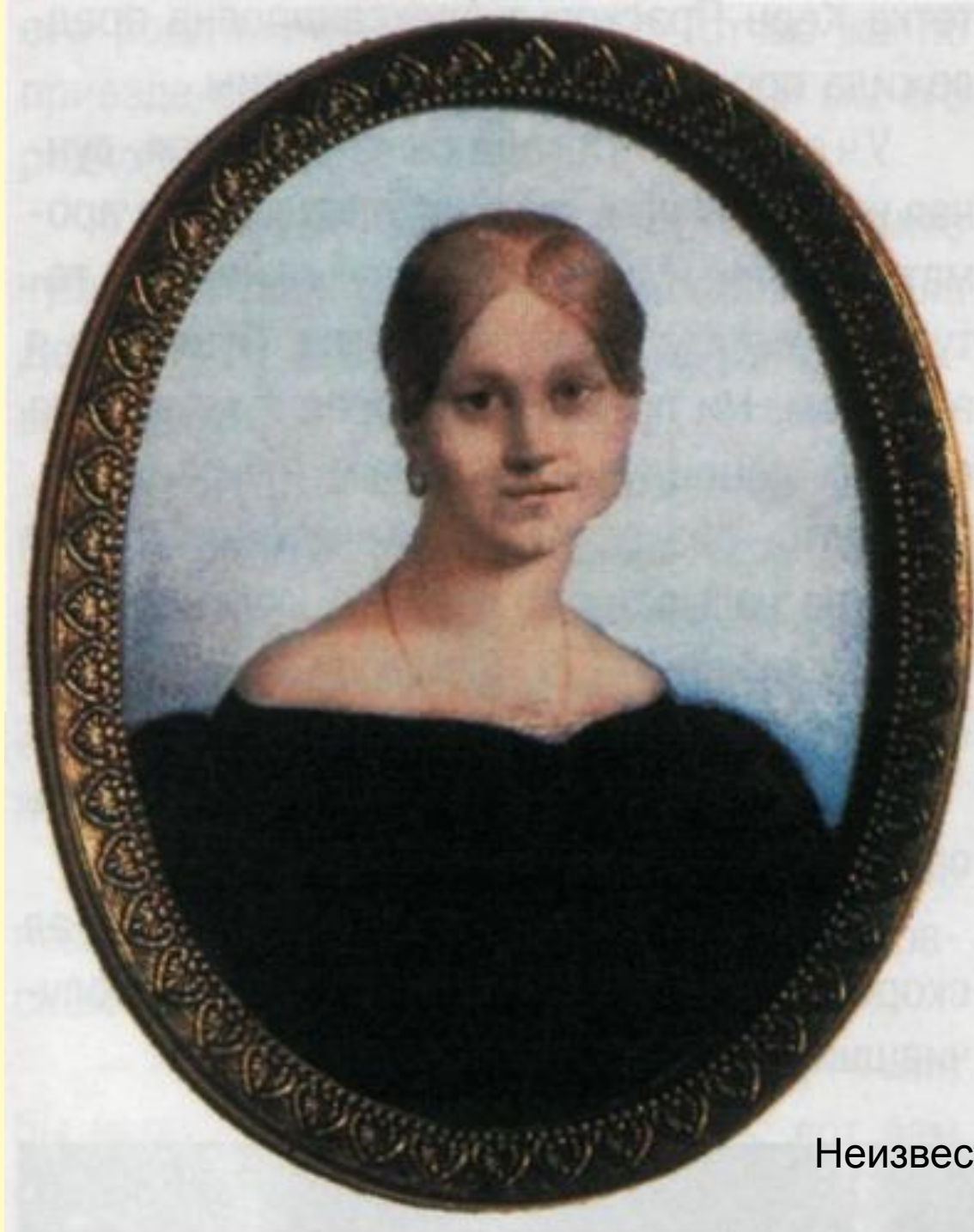
А. П. Керн. Неизвестный художник. 1820-е годы