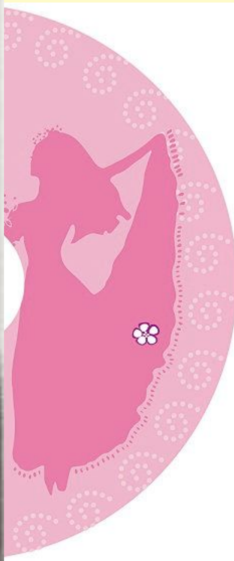
Ф.И.Иордан. А.И.Истомина. 1825