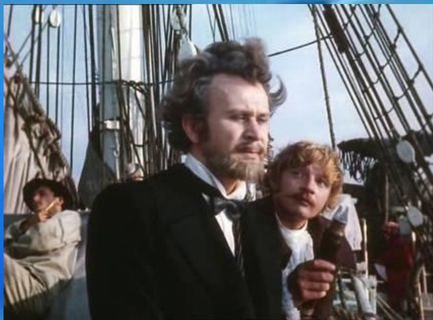
Профессор Аронакс и его слуга Консель