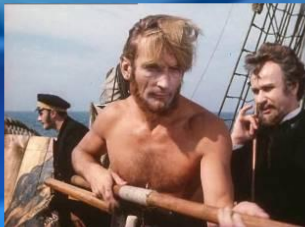
Гарпунер Нед Ленд