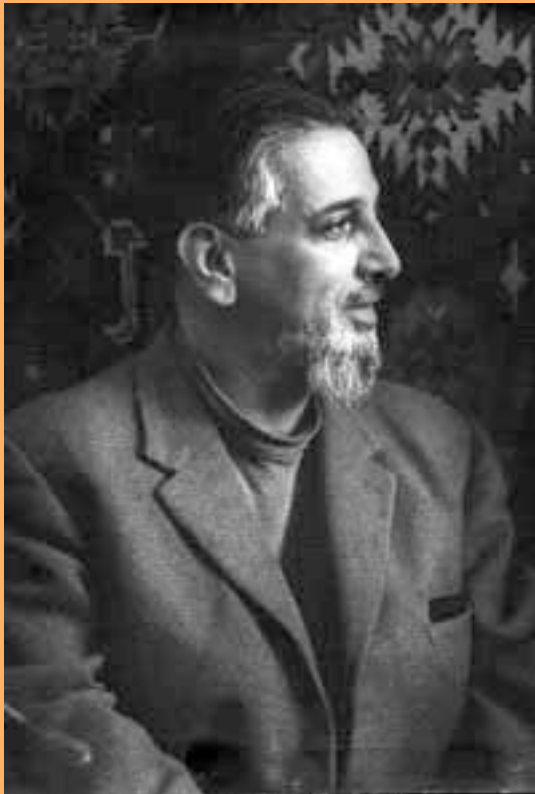
Виктор Ефимович Ардов (писатель-сатирик, драматург, сценарист)