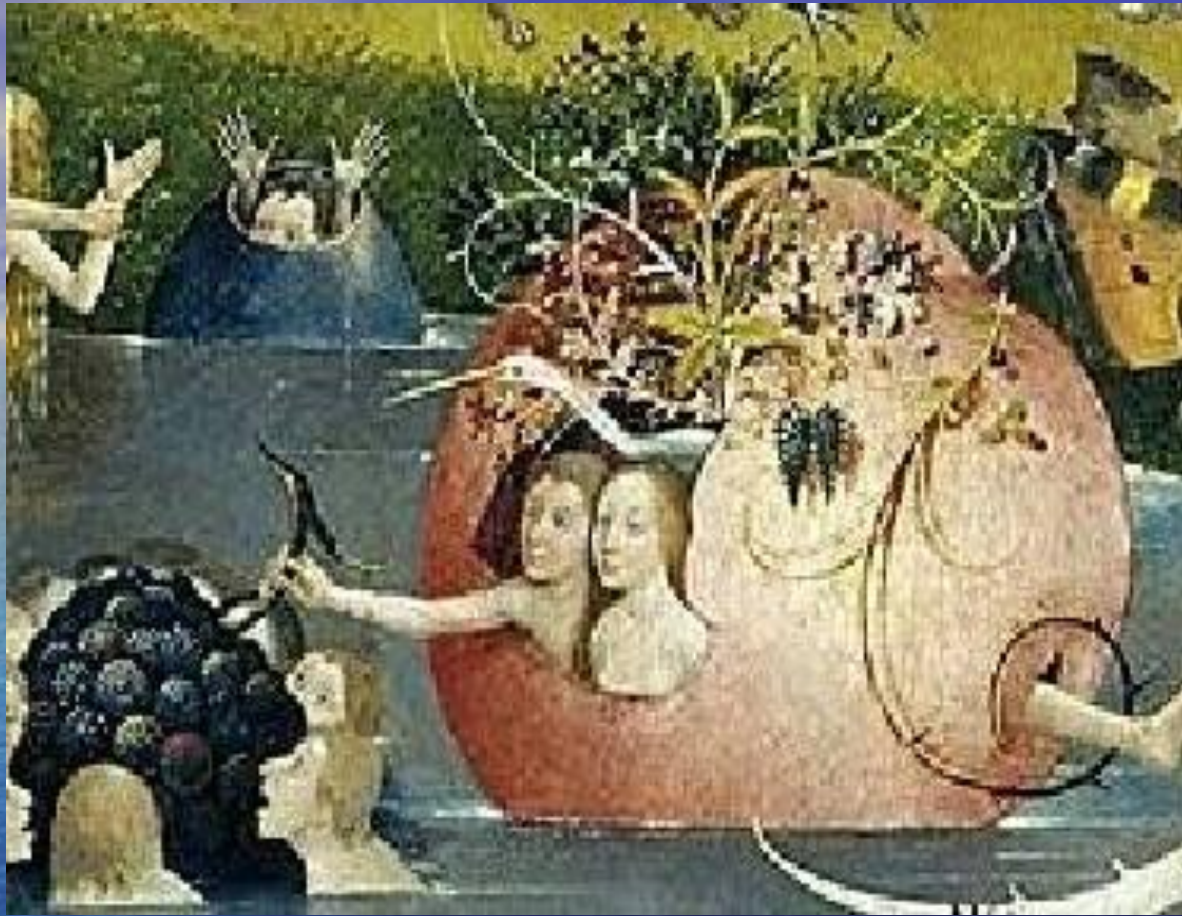
Иероним Босх «Сад земных наслаждений» (фрагмент)