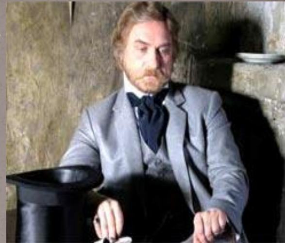
Аркадий Иванович Свидригайлов