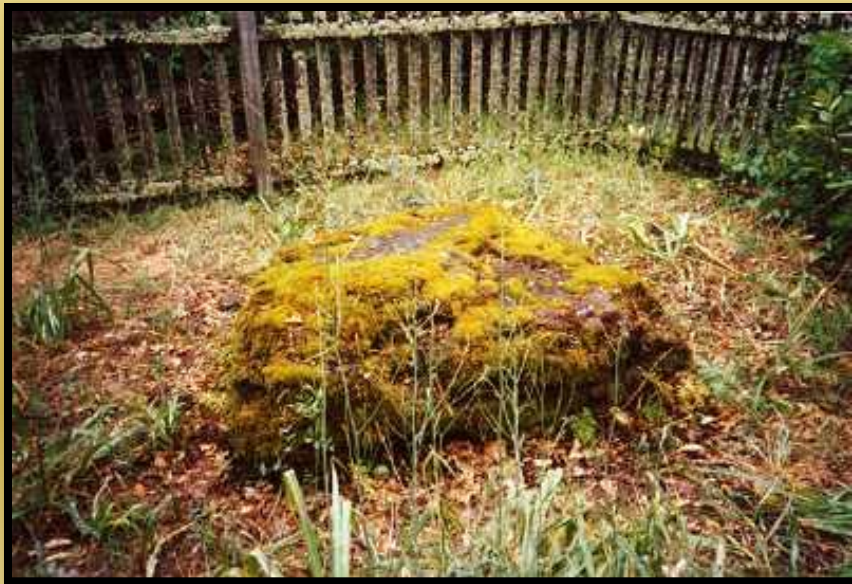
Могила Джека Лондона

В 1900 году Лондон опубликовал свою первую книгу "Сын волка». В последующие семнадцать лет он выпускал по две и даже три книги в год. Умер Лондон в Глен-Эллене (штат Калифорния) 22 ноября 1916 году.