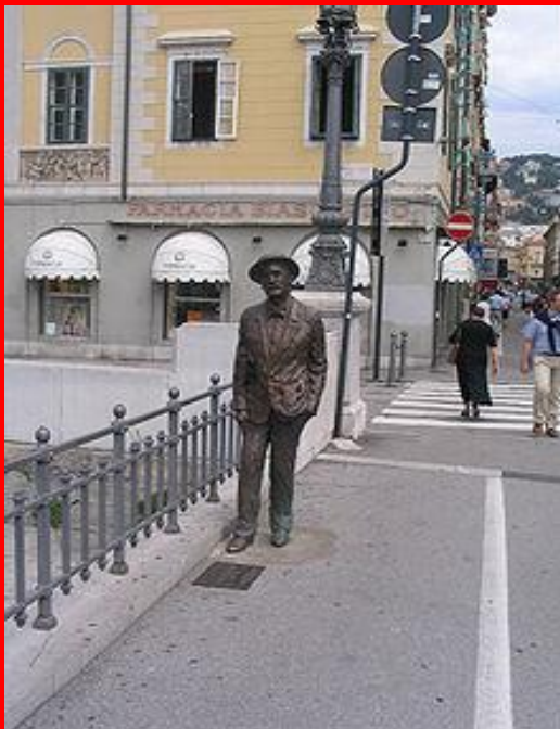
Статуя Джойса в Трієсті