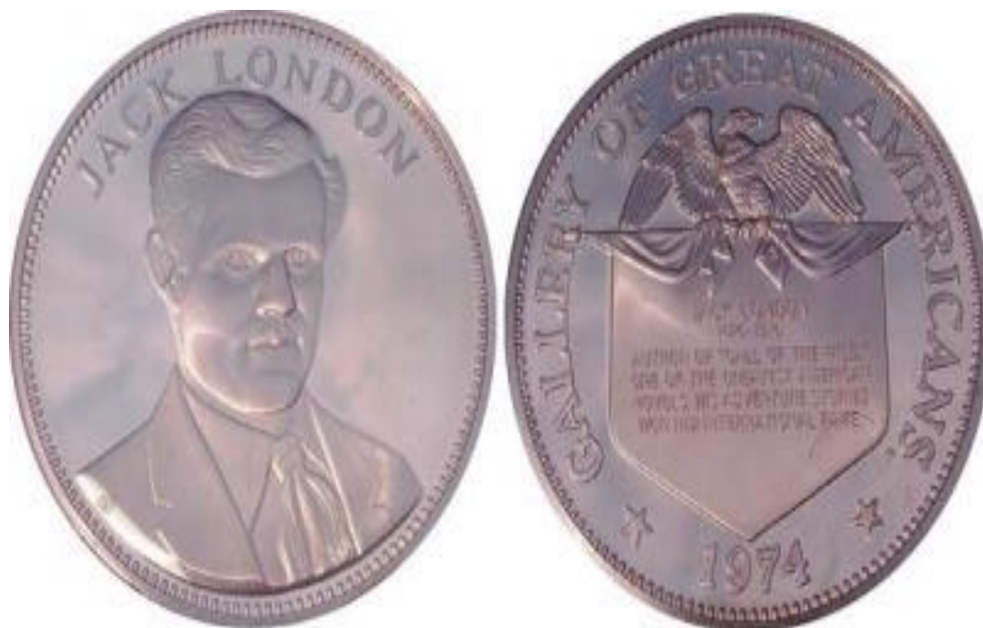
памятная медаль в честь Джека ЛОНДОНА