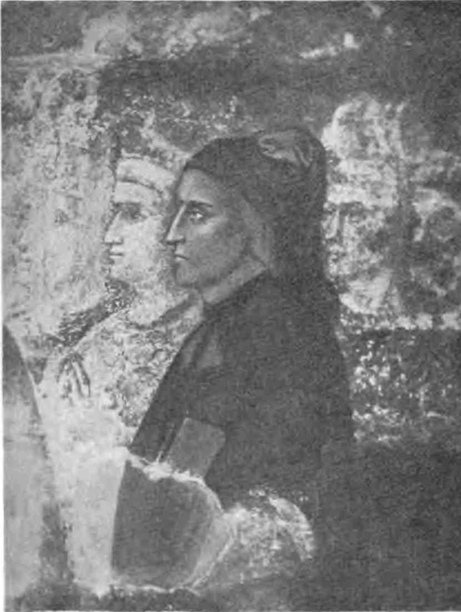
ДРЕВНѢЙШІЙ ПОРТРЕТЪ ДАНТЕ.

(Фреска Джіотто. Флоренція, Museo Nazionale).