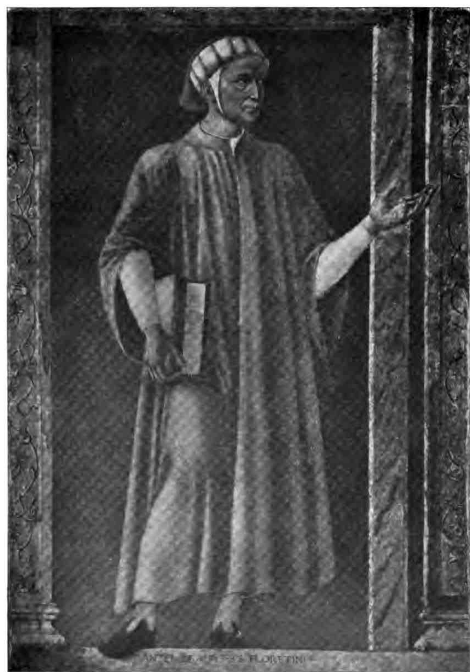
Д А Н Т Е.

(Firenze. Museo Nazionale. Ritratto di Dante Allighieri, Giotto, 1266—1337).