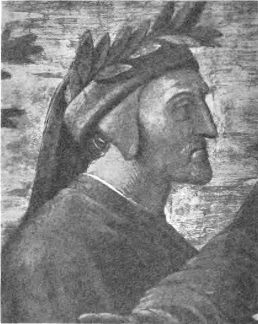
Д А Н Т Е.