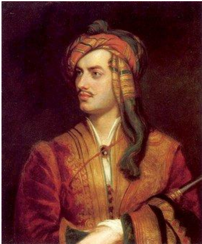
Байрон в албанському костюмі

У червні цього ж року Байрон відправився подорожувати. Можна було вважати, що молодий поет, отримавши таку блискучу перемогу над своїми літературними ворогами, поїхав за межу задоволений і щасливий, але це було не так. Байрон виїхав в страшно пригніченому стані духу, і, побувавши в Іспанії, Албанії, Греції, Туреччині і Малій Азії, повернувся в ще більш пригнобленому стані. Особи, що ототожнювали його з Чайльд-гарольдом, висловлювали припущення, що за кордоном, подібно до свого героя, він вів дуже непомірне життя, але Байрон і друкарський і усно протестував проти цього, кажучи, що Чайльд-Гарольд — плід уяви. Томас Мур говорив в захист Байрона, що він був дуже бідний, щоб тримати гарем, а, крім того живив в цей час романну пристрасть до невідомої дівчини, що їздила з ним, переодягнута хлопчиком. Байрона, очевидно, турбували його фінансові невдачі. В цей же час він позбувся матери, і хоча жив з нею далеко не в ладах, але проте дуже шкодував про неї.