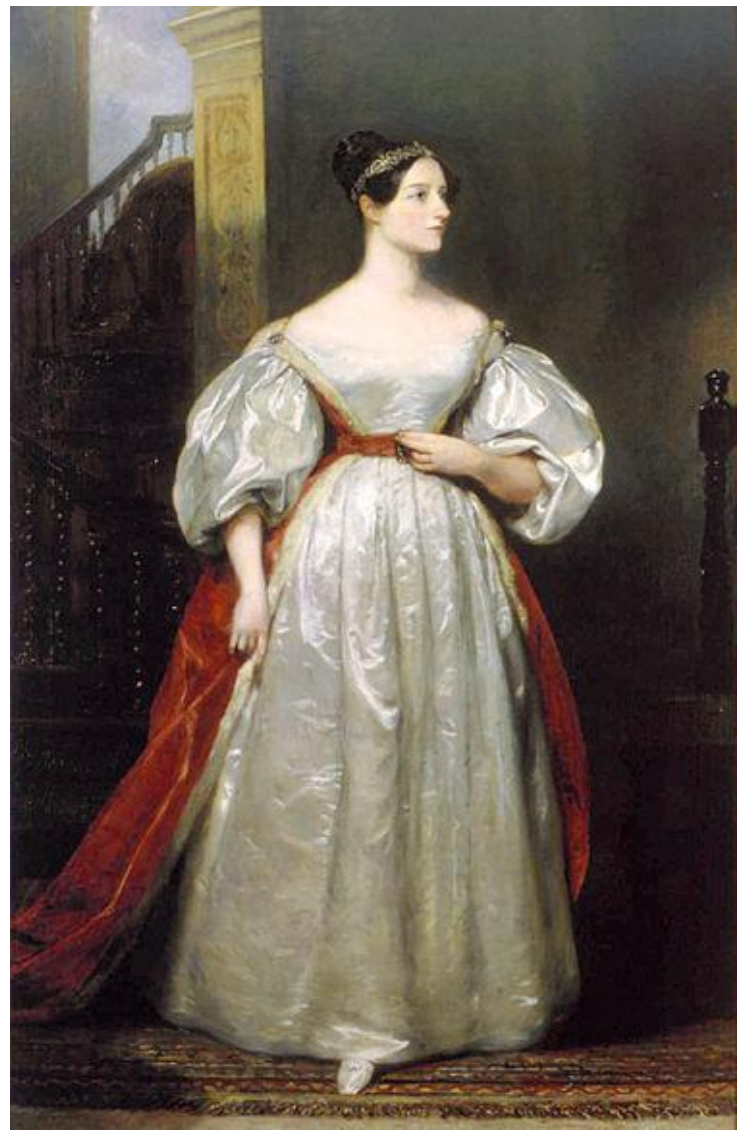
Математик Пекла Лавлейс, дочка поета

Старший внук лорда Байрона, Ноел, народився 12 травня 1836 р., недовго служив в англійському флоті, і після буйного і безладного життя помер 1 жовтня 1862 р. працівником в одному з лондонських доків. Другий внук, Ральф Гордон Ноел Мілбенк, народився 2 липня 1839 р., вступив після смерті брата, що успадкував незадовго до кончини баронство Уїнтворт від бабусі, в права лорда Уїнтворта (Wentworth).