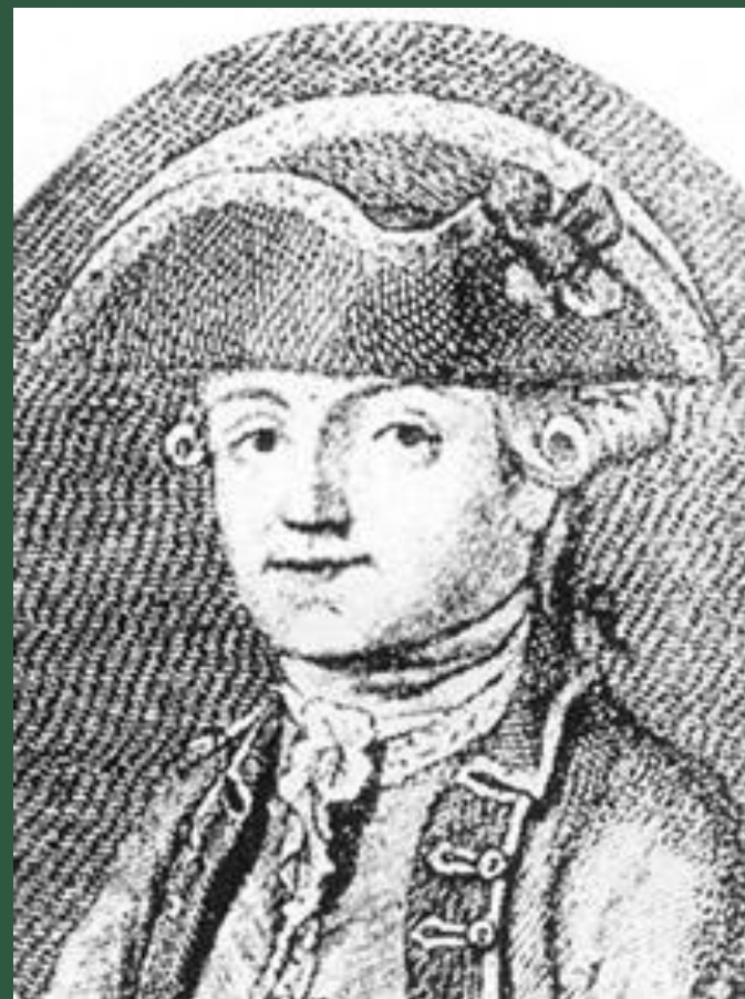
Капітан Джон Байрон, батько Джорджа Гордона Байрона.