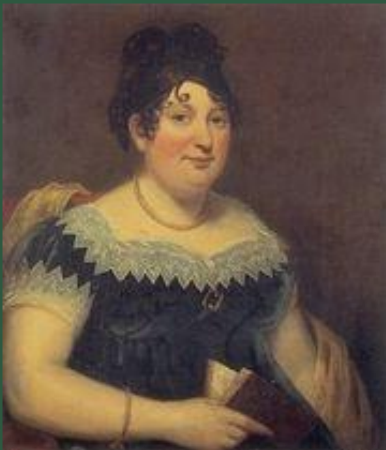
Місіс Байрон, мати Джорджа Гордона Байрона.