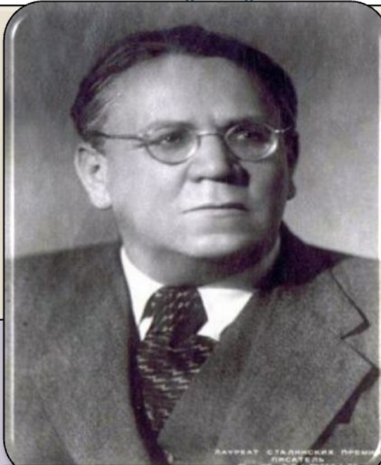
Самуил Маршак . Стихотворение "Расставание"

ДЖОРДЖ ГОРДОН БАЙРОН ПАЛОМНИЧЕСТВО ЧАРЛЬД-ГАРОЛЬДА • ДОН-ХУАН