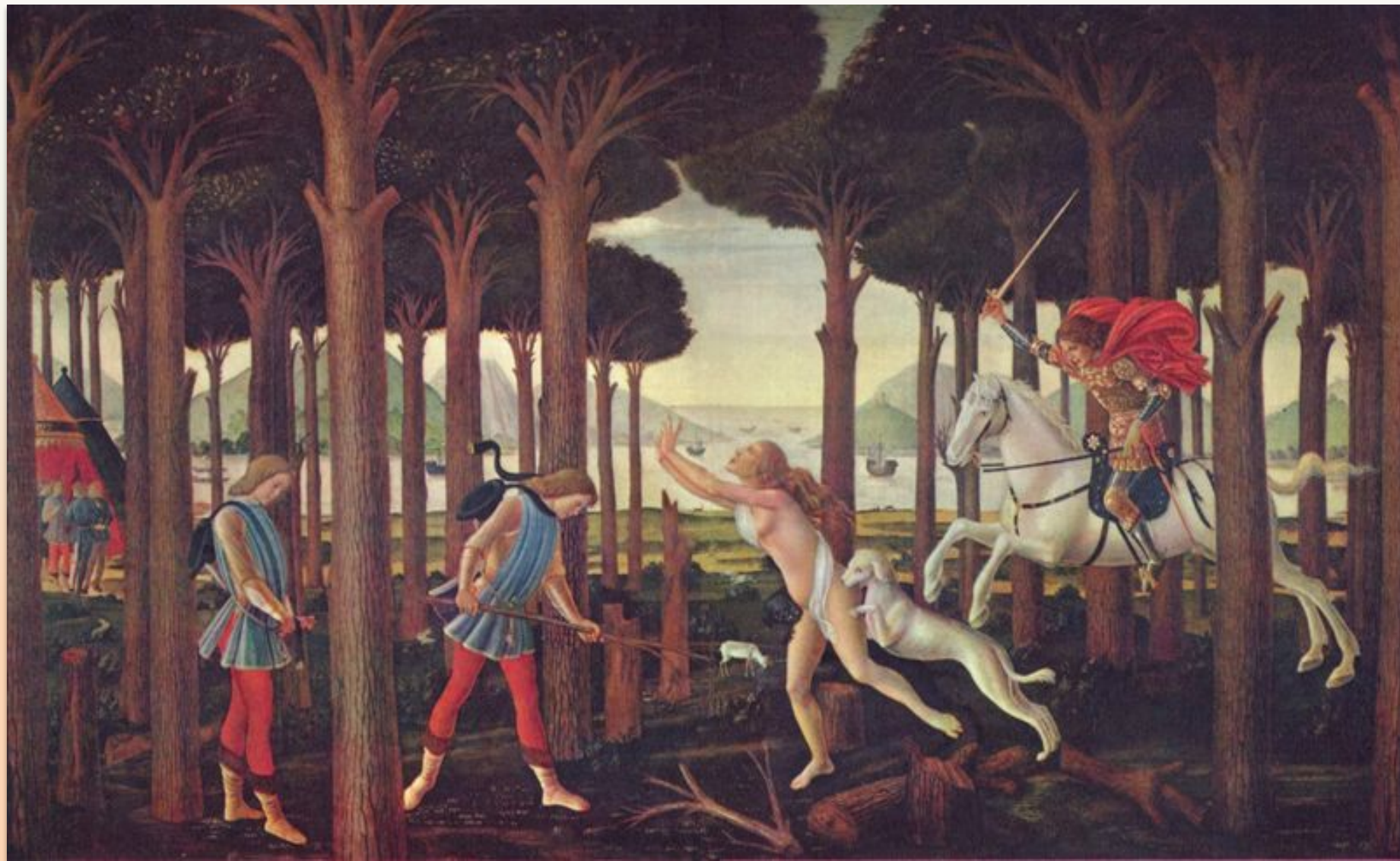
Сандро Боттичелли. Иллюстрация к новелле о Настаджо дельи Онести, 1487 Мадрид, музей Прадо