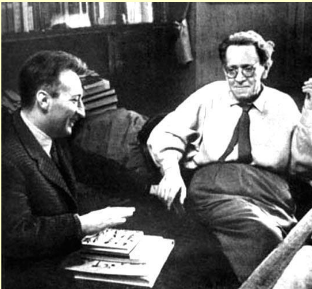
Дж. Родари и С.Я. Маршак