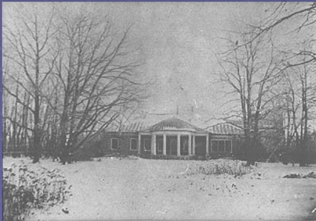
Усадебный дом в Маре. Фотография XIX в.

Позднее поэт неоднократно бывал в родовом имении, где жила его мать, брат и сестры.