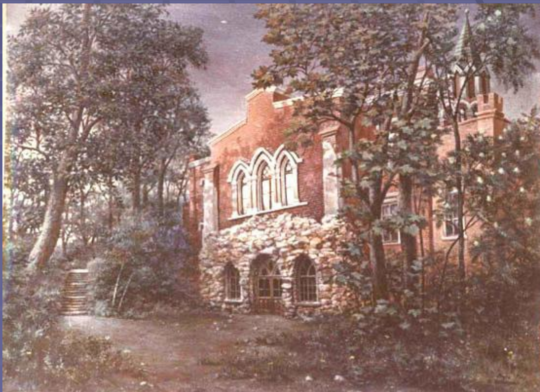
Грот. Картина- реконструкция В. Г.Шпильчина.

Как и многие тамбовские усадьбы «Мара» была культурным центром, куда приезжали многие видные деятели культуры и науки. И после смерти поэта Мара, воспетая им, долго продолжала оставаться притягательным культурным центром провинциальной России.