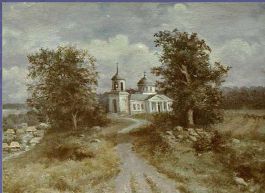
Вознесенская церковь. Картина-реконструкция В.Г.Шпильчина.

Со временем усадебный дом пришел в упадок, некогда процветавшее дворянское гнездо опустело, а после 1920 года окончательно исчезло с лица земли, разделив судьбу многих дворянских усадеб. О том, какой была усадьба, мы знаем по воспроизведенным по воспоминаниям старожил эскизам и нескольким сохранившимся фотографиям.