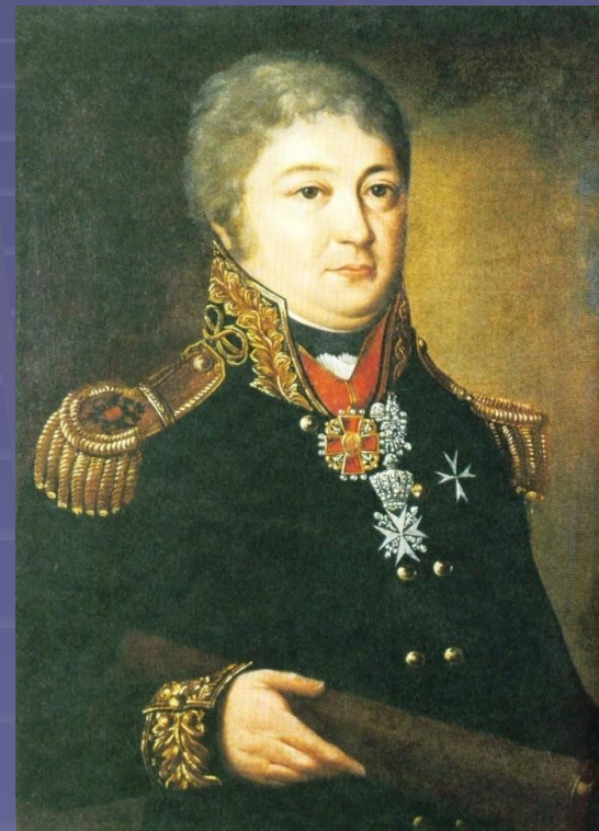
Богдан Андреевич Боратынский 1769/70-1820