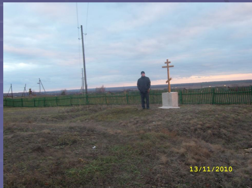
Место, где стояла церковь.