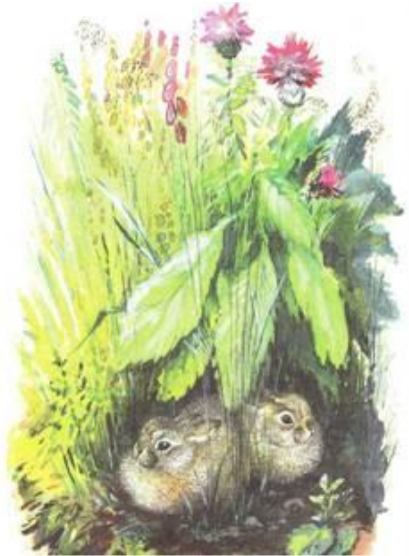
Рис. Е. И. Чарушина

Зеленую страну населяют удивительные жители! Встречи там неожиданные, голоса звучат неслыханные, а уж загадки – на каждом шагу! Спросите, где же эта страна? Она не за горами, не за морями, а рядом перед вами.