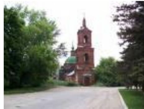
Старо-Казанский собор со стороны реки Дон