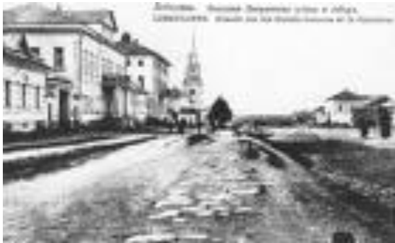
Лебединь. Большая Дворянская улица.