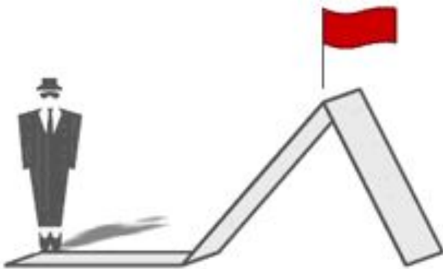
Тип мотивации «К»