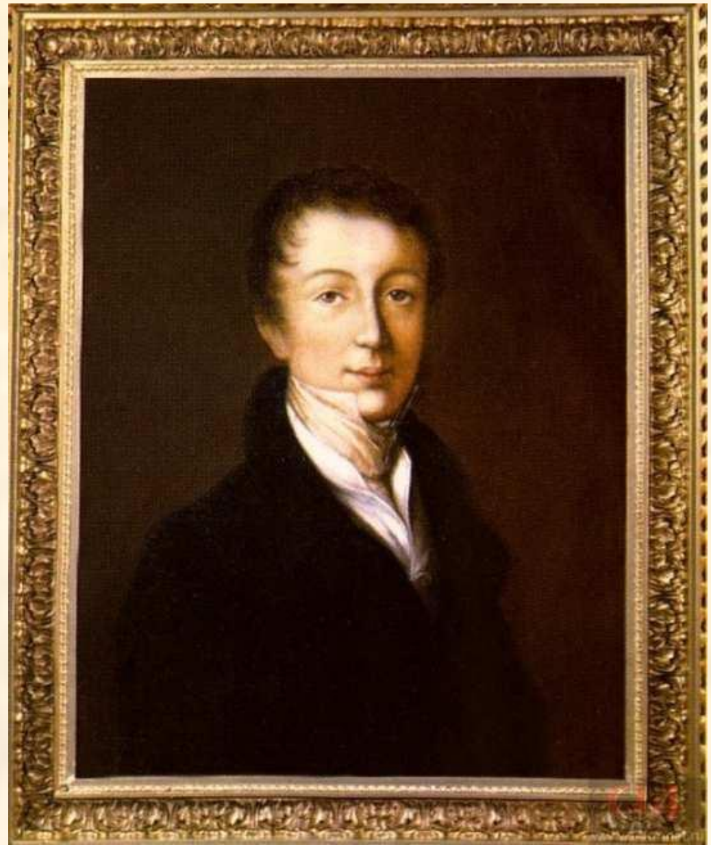
Ф.И. Тютчев. Неизвестный художник. 1819–1820

И ты с веселостью беспечной Счастливым провожала день; И сладко жизни быстротечной Над нами пролетала тень.