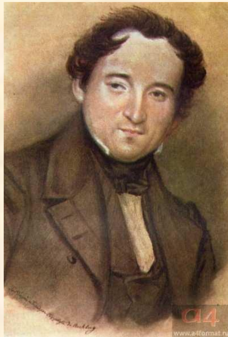
Ф.И. Тютчев. Художник И. Рухберг. 1838

Так мило-благодатна, Воздушна и светла, Душе моей стократно Любовь твоя была. (1858)