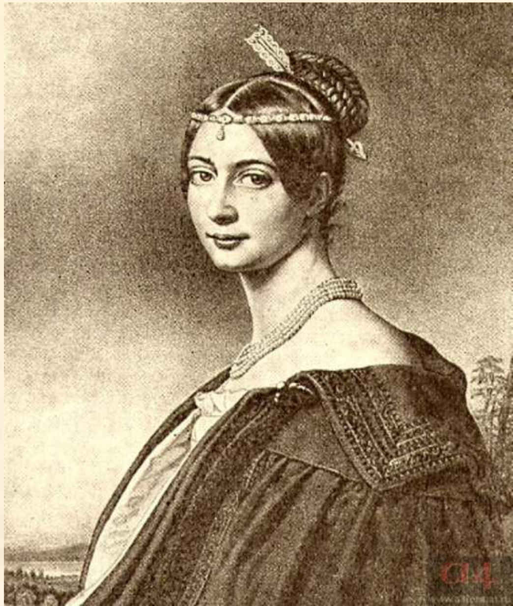
Эрнестина Дёрнберг. Литография Г. Бодмера с портрета работы Й. Штилера. Мюнхен. 1833

Люблю глаза твои, мой друг, С игрой их пламенно- чудесной, Когда их приподынешь вдруг И, словно молнией небесной, Окинешь бегло целый круг... Но есть сильнее очарованья: Глаза потупленные ниц, В минуты страстного лобзанья, И сквозь опущенных ресниц Угрюмый, тусклый огонь желанья.