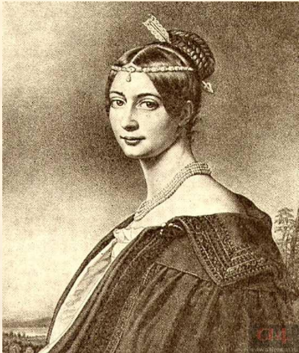
Эрнестина Дёрнберг. Литография Г. Бодмера с портрета работы Й. Штилера. Мюнхен. 1833

Люблю глаза твои, мой друг, С игрой их пламенно- чудесной, Когда их приподынешь вдруг И, словно молнией небесной, Окинешь бегло целый круг... Но есть сильнее очарованья: Глаза потупленные ниц, В минуты страстного лобзанья, И сквозь опущенных ресниц Угрюмый, тусклый огонь желанья.