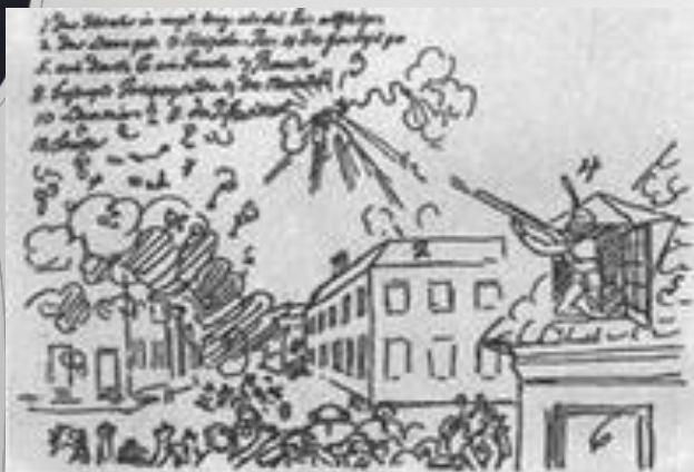
Пожар в театре. Рисунок Гофмана.