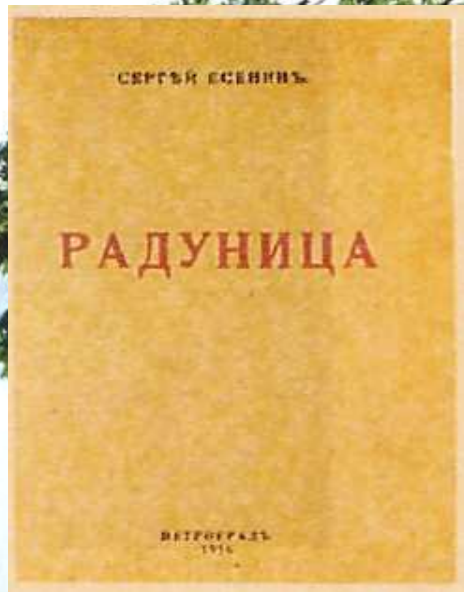
С. Есенин. Обложка. 'Радунца', 1916г.

В начале 1916 года выходит первая книга «Радунца» , в которую входят стихи, написанные Есениным в 1910-1915 годах. Есенин позже признавался: «Моя лирика жива одной большой любовью, любовью к родине. Чувство родины - основное в моем творчестве». Один из основных законов мира Есенина - это всеобщий метаморфизм. Люди, животные, растения, стихии и предметы - все это, по Есенину, дети одной матери-природы. Он очеловечивает природу. Книга пропитана фольклорной поэтикой (песня, духовный стих), ее язык обнаруживает немало областных,