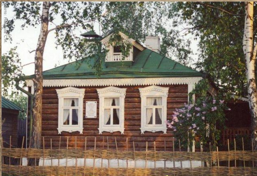
Дом-музей С. Есенина в с. Константиново

Стихи начал писать с 8 лет. В 1912-1915 гг. учился в Москве в Народном университете Шанявского и работал корректором. С 1914 г. Есенин начал печататься в детских изданиях «Проталинка», «Мирок», «Новь» и др.