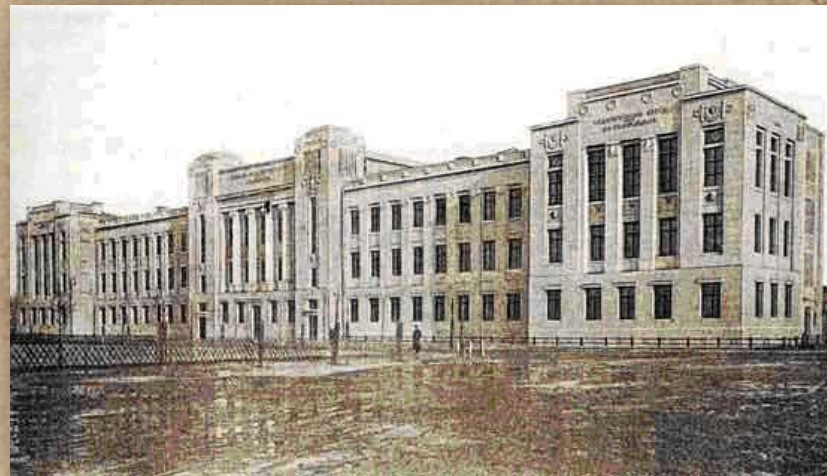
Народный университет им. А.Л. Шанявского