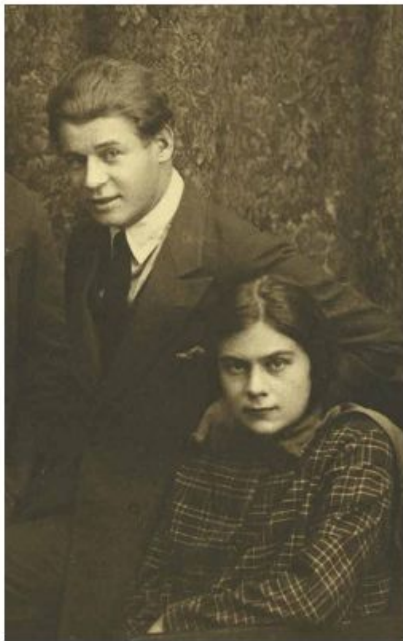
С.А. Есенин и С.А. Толстая-Есенина.