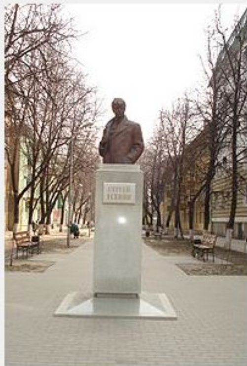
Памятник С. А. Есенину в Воронеже