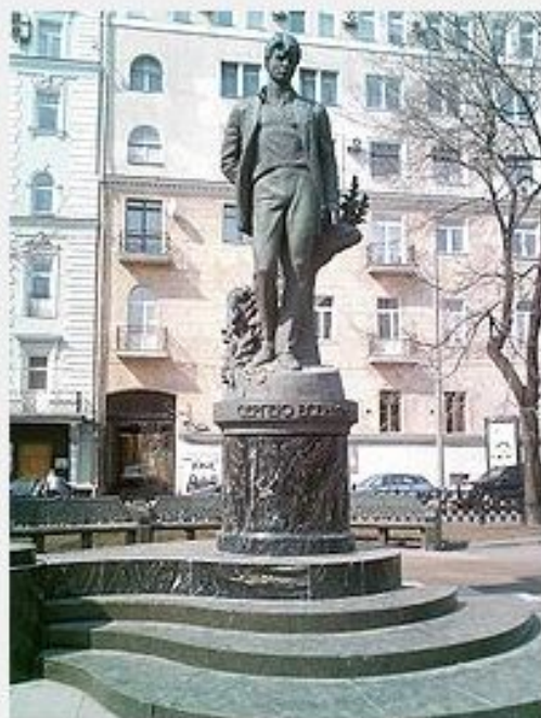
Памятник С. А. Есенину на Тверском бульваре в Москве