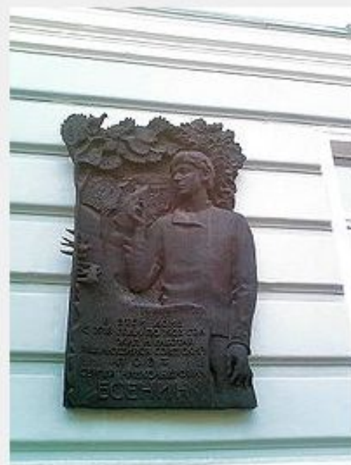
Барельеф Сергея Есенина на доме, в котором он жил со своей женой, Софьей Толстой. Москва , Петровский пер.