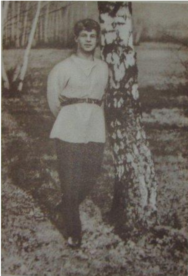
С. Есенин. Кадр из документального кинофильма «Сергей Есенин». 1918.