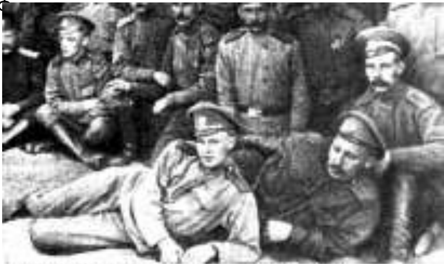
Сергей Есенин в армии среди военных санитарного поезда (1916)

В первой половине 1916 г. Есенин призывается в армию, но благодаря хлопотам друзей получает назначение санитаром в Царскосельский военно-санитарный поезд № 143 Ее Императорского Величества Государыни Императрицы Александры Ф