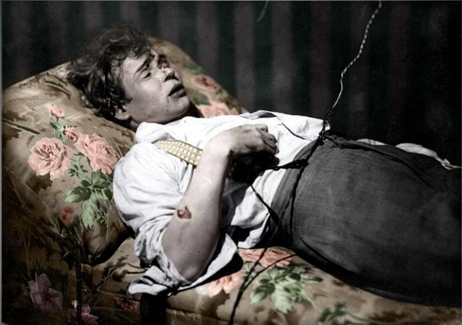
Посмертное фото Есенина