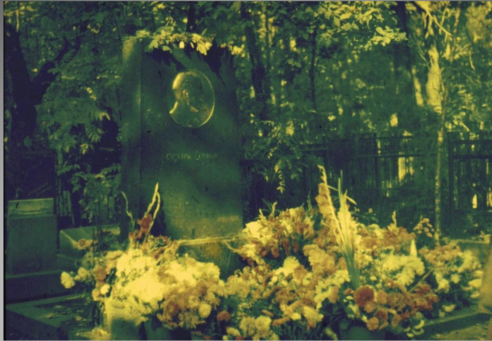
Могила Сергея Есенина в 1983 году