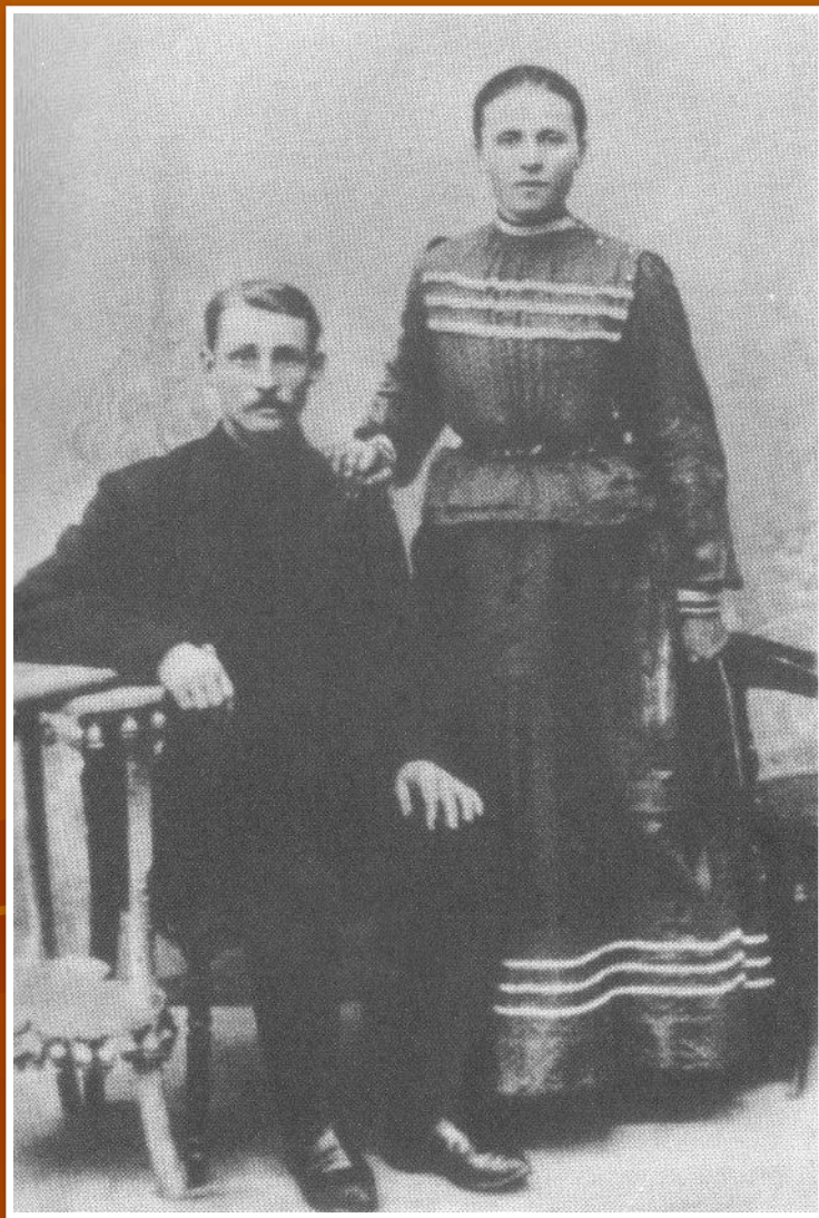
Родители поэта - потомственные рязанские хлеборобы