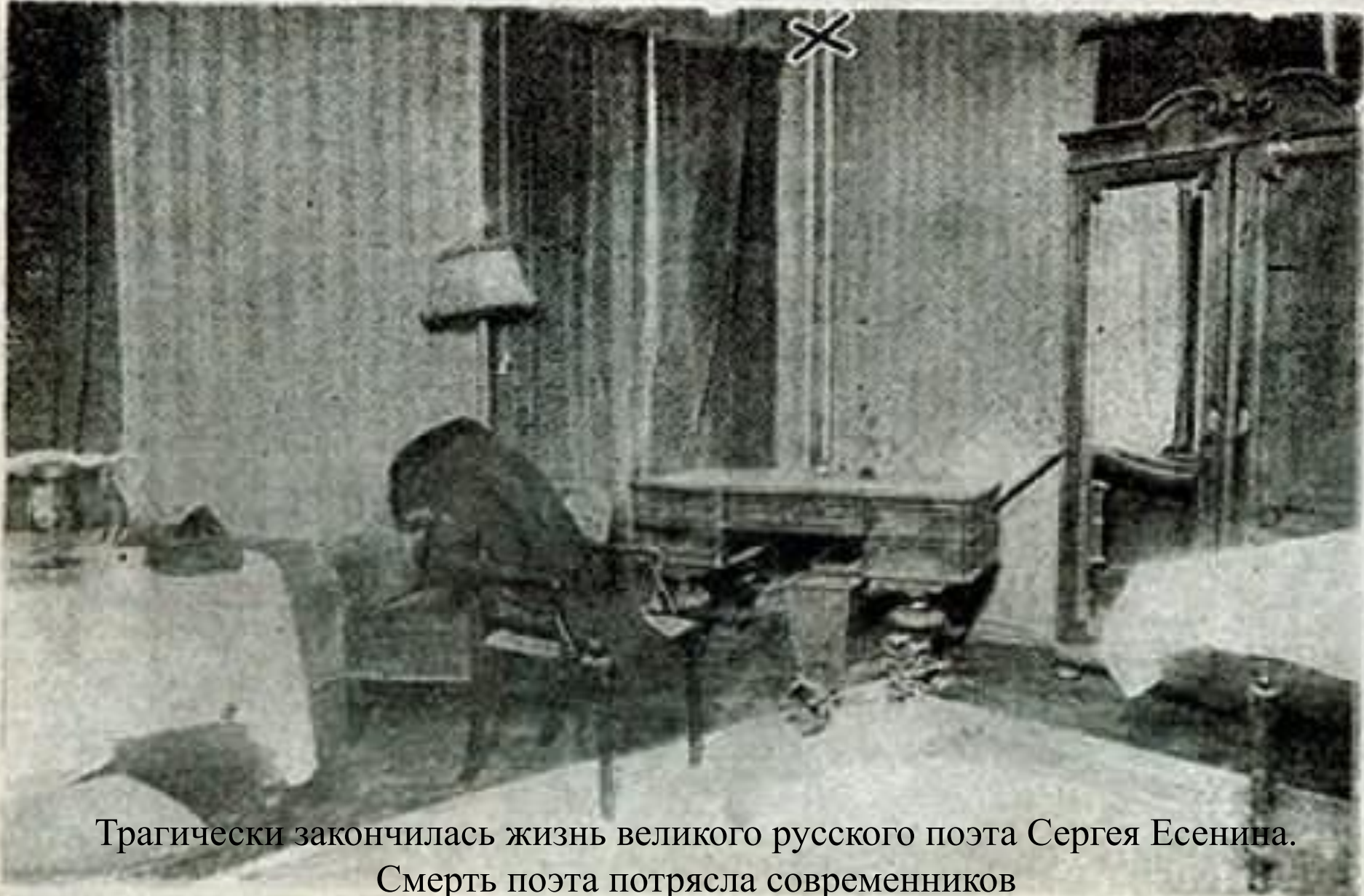
Трагически закончилась жизнь великого русского поэта Сергея Есенина. Смерть поэта потрясла современников