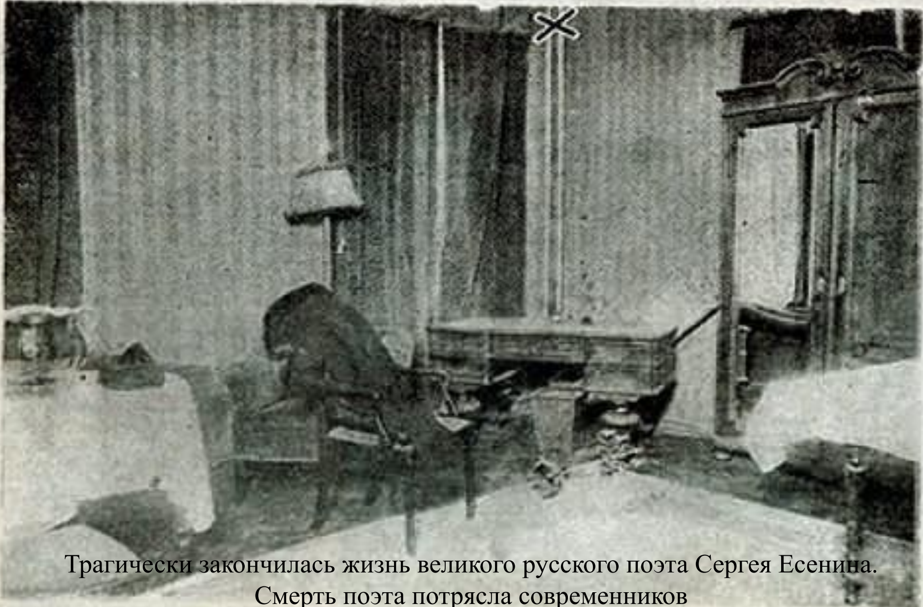
Трагически закончилась жизнь великого русского поэта Сергея Есенина. Смерть поэта потрясла современников

№ 5 Гостиница, где покончил жизнь Есенин. В углу тумба, на которую встал и затем оттолкнулся Есенин. Простым откинуто место, куда прикрывалась голова березня. Обстановка выцветшая и тусклости соответствующая.