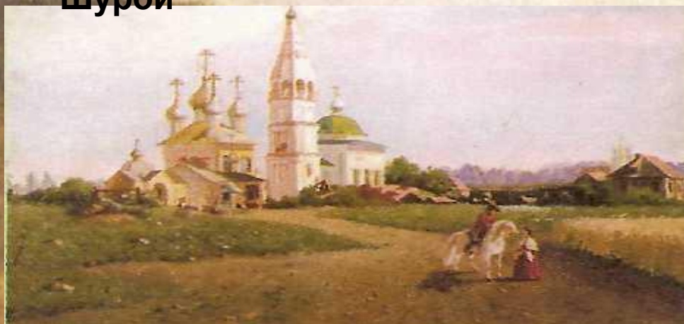
Окрестности села Константиново