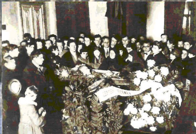
У гроба С. А. Есенина в Доме Печати.

Жизнь С.А. Есенина трагически оборвалась в Петрограде, в гостинице «Англетер» при невыясненных обстоятельствах. Поэта нашли повешенным. После гибели Есенина начался период официального забвения его творчества. В 1927 году появилась статья Бухарина «Злые заметки». Творчество поэта было признано мелкобуржуазным, кулацким, не соответствующим великой эпохе. Статья на много лет стала идеологической основой для