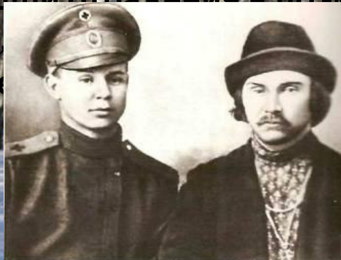
С. А. Есенин и Н. А. Клюев