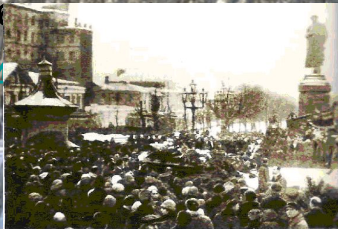
Похоронная процессия у памятника Пушкину. Москва