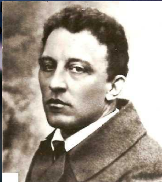
А. А. Блок Фотография. 1916