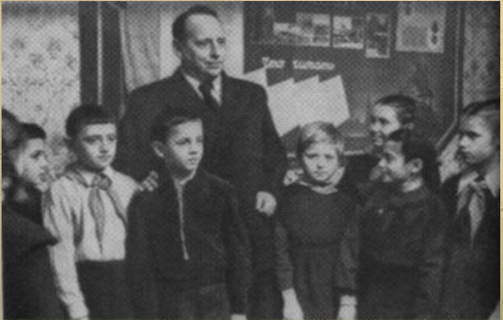
Е. Шварц в кругу детей