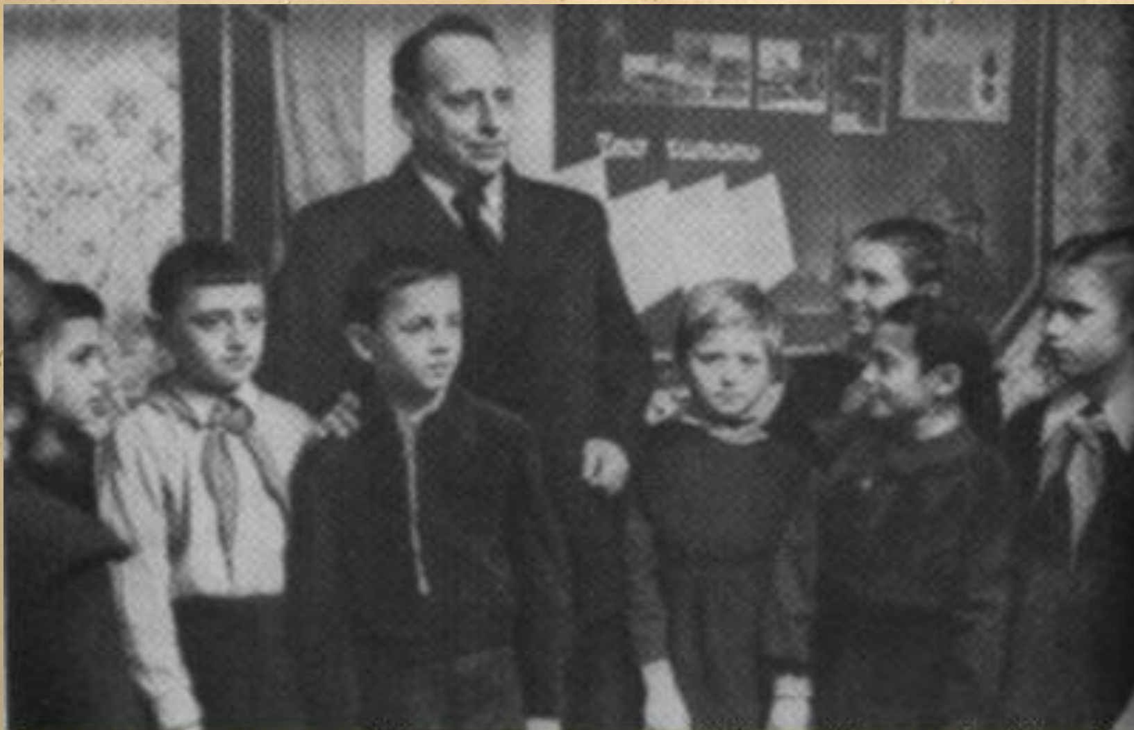
Е. Шварц в кругу детей