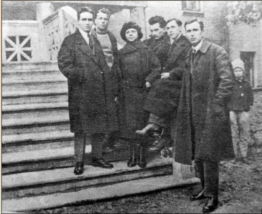
Члени літературного об'єднання «Ланка». Зліва направо: Борис Антоненко- Давидович, Григорій Косинка, Марія Галич, Євген Плужник, Валер'ян Підмогильний, Тодось Осьмачка. 1925 рік.

1923 року Микола Зеров залучає Євгена Плужника до Асоціації письменників ( «Аспис» ), що об'єднувала тоді всю "непролетарську" літературу Києва. 1924 року Плужник стає членом письменницької групи "Ланка" , яка 1926 року перетворюється на "Марс" (майстерня революційного слова). На чолі "Марсу", як і "Ланки", стояли Борис Антоненко-Давидович, Валеріан Підмогильний, Григорій Косинка. "Марс" вважали за київську неофіційну філію харківської ВАПЛІТЕ . Обидві організації були розгромлені і ліквідовані одночасно 28 січня 1928. р.