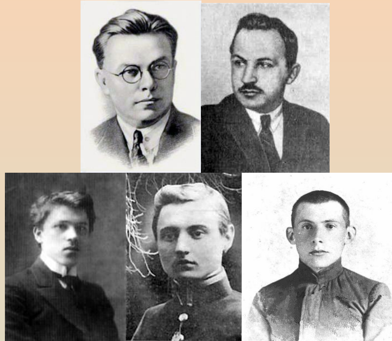
П'ятірка неокласиків 20-х років. (Зверху зліва на право) М.Зеров, П.Филипович, М.Драй-Хмара, М. Рильський, Юрій Клен

Неокласики — група українських поетів та письменників-модерністів початку 20 століття. Неокласики позиціонували себе як естетів і жорстко протиставляли себе народництву і романтизму. Крім художньої творчості, члени групи були також активними літературними критиками та теоретиками українського модернізму.