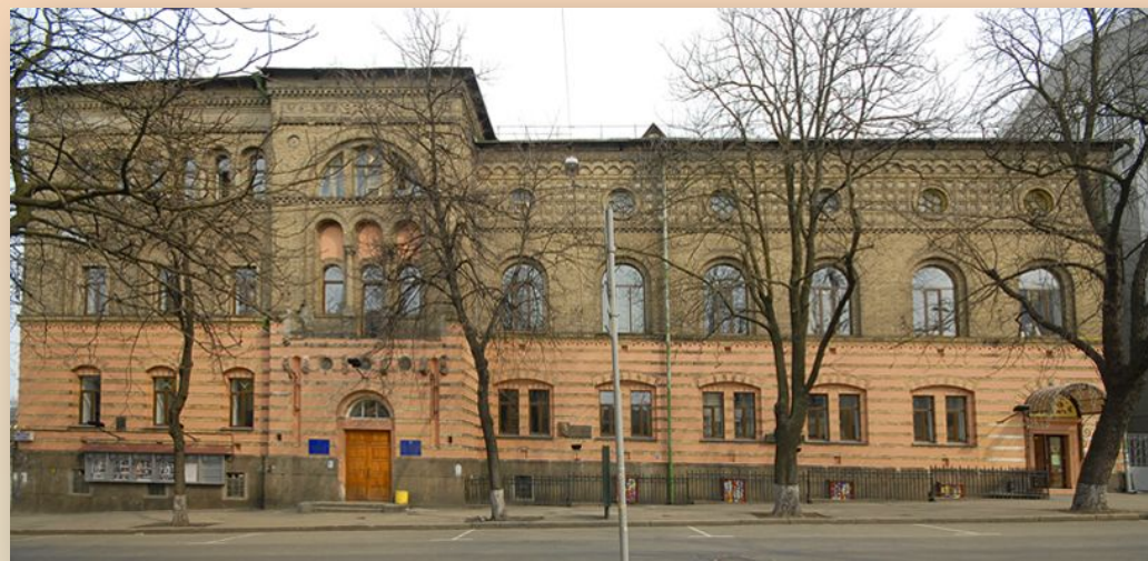
Музично-драматичний інститут ім. Лисенка (Нині Київський національний університет театру, кіно і телебачення імені Івана Карпенка-Карого

1918 року разом з родиною переїхав на Полтавщину. Під час громадянської війни вчителював у селі Великі Багачки Миргородського повіту на Полтавщині, де організував драматичний гурток із залученням сільської молоді. Навчаючи дітей, він одночасно поглиблював і свої знання. Але самоосвіта його незадовільняла, і він їде до Києва, де навчається у Ветеринарно-зоотехнічному інституті. Невдовзі він вступає до Київського музично-драматичного інституту ім. Лисенка. Акторські здібності Плужника, його гумор та дотепність цінують викладачі й товариші, пророкують перспективне сценічне майбутнє, але він залишає навчання знайшовши своє справжнє покликання у поезії.