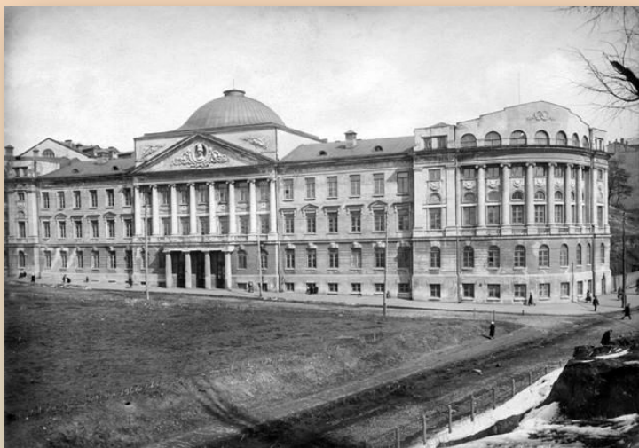
Ветеринарно-зоотехнічний інститут. 1999 рік