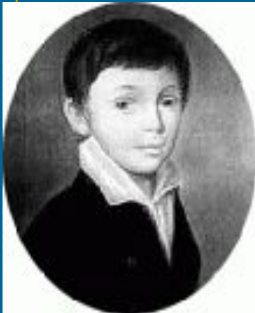
Портрет Е.А. Баратынского в детстве. Пастель Барду.