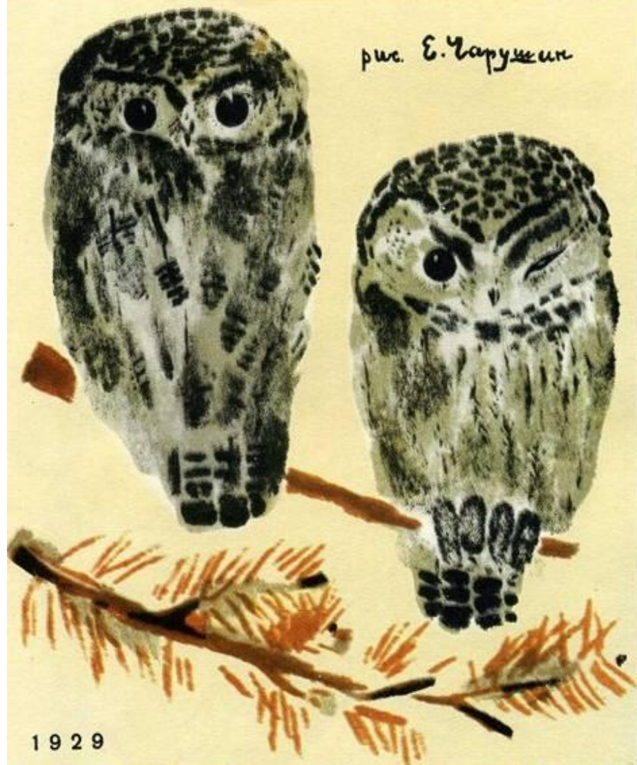
рис. Е. Чарушин