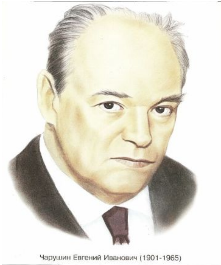
Чарушин Евгений Иванович (1901-1965)