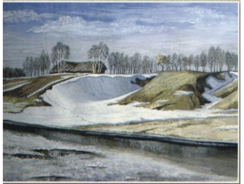
Образы в снегу