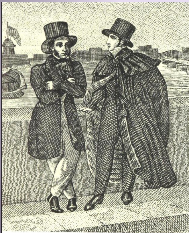
Боливар. Иллюстрация к 1-й главе «Евгения Онегина» А. С. Пушкина. Гравюра Е. Гейтмана с рисунком А. Нотбека.

«Надев широкий боливар, Онегин едет на бульвар...»