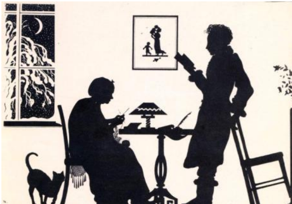
А.С. Пушкин с няней Ариной Родионовной