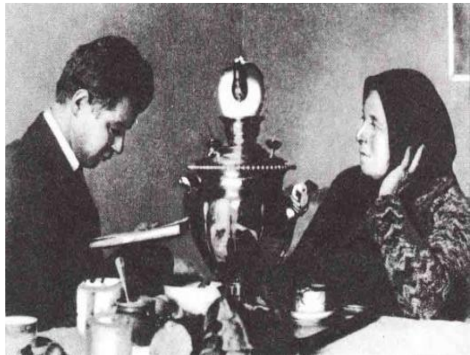
С.А. Есенин с матерью Татьяной Фёдоровной