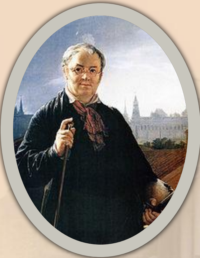
В. Тропинин 1776 -1857