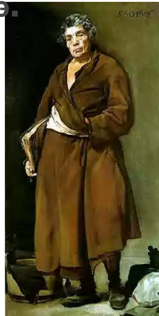
Картина Диего Веласкеса