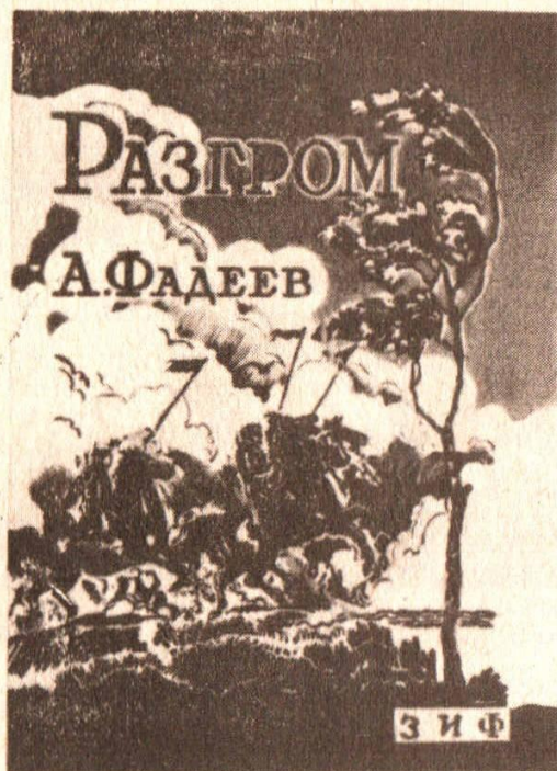
Обложка одного из первых изданий романа А. Фадеева «Разгром».

“В гражданской войне происходит отбор человеческого материала, всё враждебное сметается революцией, всё неспособное к настоящей революционной борьбе, случайно попавшее в лагерь революции отсеивается, а всё поднявшееся из подлинных корней революции, из миллионных масс народа, закаляется, растёт, развивается в этой борьбе. Происходит огромнейшая переделка людей”.