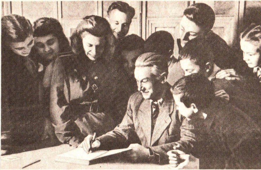
А. Фадеев среди детей. 19.IX.1946 г. Неделя детской книги.